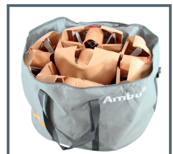
Tragetasche für für das AmbuMan Compression 5er Set

Ambu A/S Baltorpbakken 13 DK - 2750 Ballerup Denmark Tel. +45 7225 2000 Fax +45 7225 2053 www.ambu.com