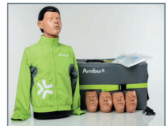
AmbuMan Defib Torso

Weiteres Zubehör und Ersatzteile auf Anfrage vorhanden.