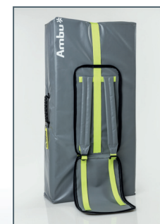
Transporttasche mit integrierter Trainingsmatte und Rucksackfunktion