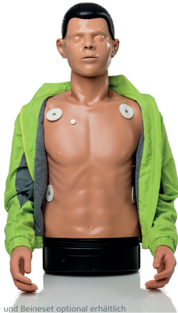
Arme- und Beineset optional erhältlich