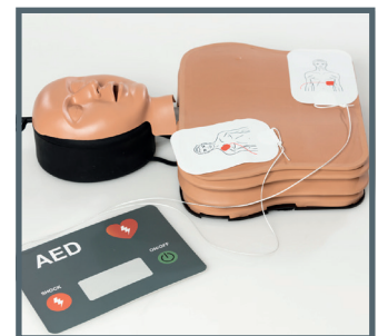
Platzierung der Defibrillationselektroden