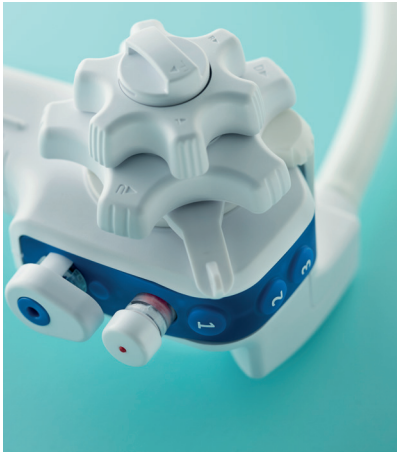
Ambu aScope Duodeno